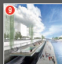
WELLNESS-SCHIFF Die schwimmende Ruheseite für Körper und Geist